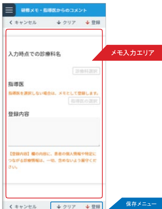
<新規メモ・コメント入力画面>