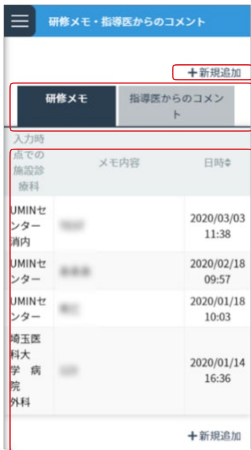
<研修メモ・指導医からのコメント一覧画面>